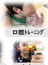
ビジョントレーニング