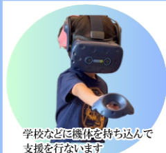
学校などに機体を持ち込んで 支援を行います