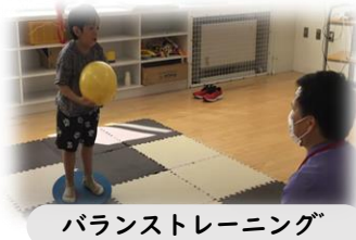
バランストレーニング