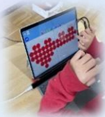
ミヤスクキッズ (ビジョントレーニング)