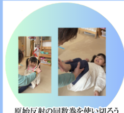
原始反射の回数券を使い切ろう

HAL®(Hybrid Assistive Limb®)は、身体機能を改善・補助・拡張・再生することができる、世界初の装着型サイボーグです。人が体を動かそうとすると、その運動意思に従って脳から神経を通じて筋肉に信号が伝わり、その際、微弱な「生体電位信号」が体表に漏れ出てきます。HAL®は、装着者の「生体電位信号」を皮膚に貼ったセンサーで検出し、意思に従った動作を実現します。