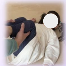
原始反射統合ワーク

お腹の中にいる時～生まれてから1年くらいは皆「原始反射」を持っており、それはドミノ倒しのように順番に連続に現れる回数券のようなものです。大きくなっても「原始反射」が残存している人が一定数いらっしゃいますが、脳の発達統合を促し「原始反射」の残存を改善し、大脳新皮質など上位脳の活動を高め感情コントロール力や集団生活への適応力、集中力や学習力などを向上させることが生き辛さの軽減・解消に繋がります。ビジョントレーニングや足部の発達過程も確認します。