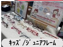
キッズ/ジュニアフレーム