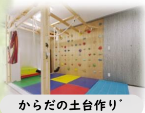
からだの土台作り